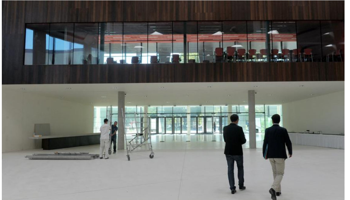
Des espaces aérés et des perspectives dégagées font de ce « nouveau » palais de la musique et des congrès un outil séduisant pour le tourisme d'affaires.