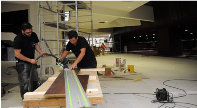
Les ouvriers sont encore à l'œuvre pour boucler des travaux de menuiserie ou de finitions pour le congrès de samedi.

L e maire Roland Ries ne s'en cache pas : il s'agit de reconquérir la 2 e place du tourisme de congrès. Une position enviable – dans la compétition à laquelle se livrent les grandes métropoles –, que Strasbourg a perdue au fil des années. Notamment lorsque l'équipement – qui était à la pointe en 1976, lors de sa conception, puis en 1988 au moment de sa première extension – a perdu de sa superbe et que d'autres villes ont énormément investi.