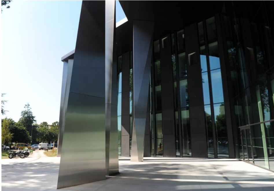
Le péristyle en inox donne du cachet et de l'unité aux trois bâtiments qui composent le PMC, redessiné par les cabinets d'architectes Rey-Lucquet et Dietrich Untertrifaller.