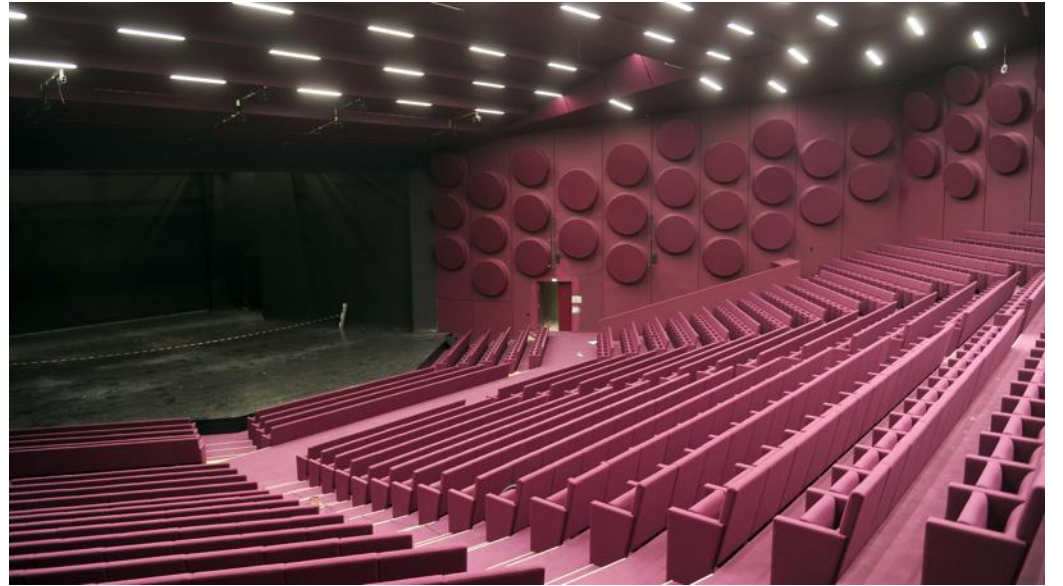
Les sièges de la salle Erasme ont été changés et un travail sur l'acoustique a été effectué. La jauge reste à 1 800 places.

tectes Rey-Lucquet et Dietrich Untertrifaller, sera inauguré cet automne et sera utilisé le week-end prochain pour le congrès sur la géothermie. Sa nouvelle façade, avec un péristyle en inox, donne un cachet et une unité aux trois bâtiments d'époques différentes qui le constituent. La construction du troisième grand hall (sur un ancien parking), ainsi que d'autres ajouts, font grimper la surface de 30 000 m 2 à 50 000 m 2 : ce qui en fait, par la taille, l'un des plus grands ensembles de ce type en France. D'importants travaux permettent, en outre, d'en faire une infrastructure aux performances énergétiques accrues.