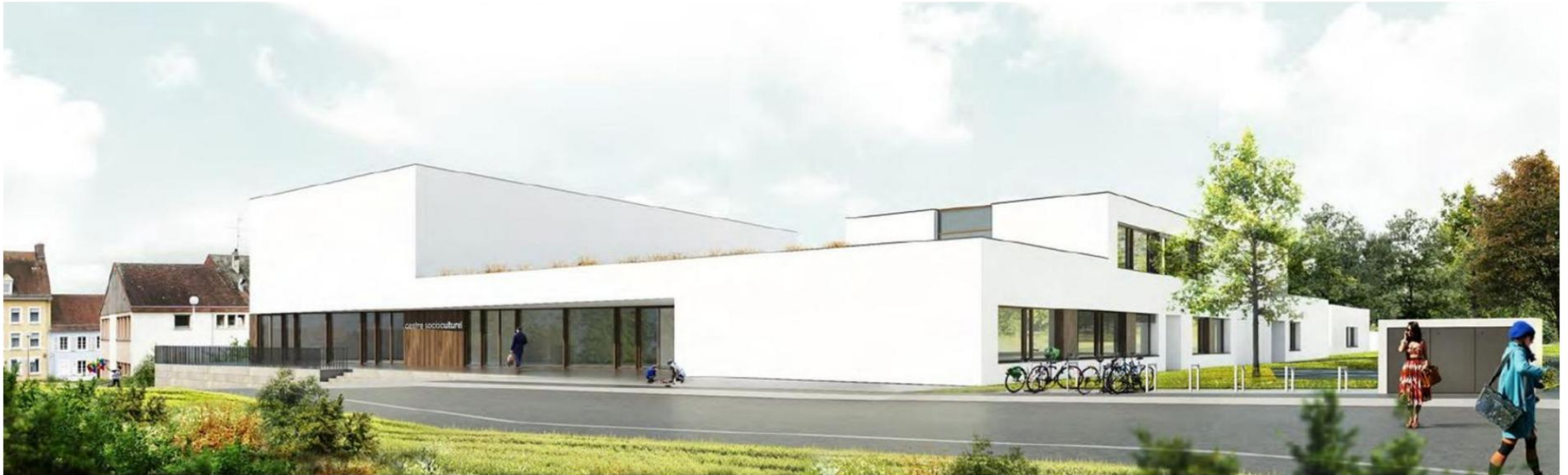
Le visage du futur centre socioculturel de Sarre-Union a été dévoilé jeudi soir, lors du conseil municipal. DOCUMENTS REMIS - ARCHITECTE REY-LUCQUET ET ASSOCIÉS - STRASBOURG