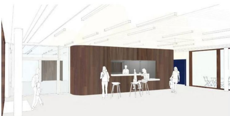
Dans le hall d'accueil, le bar devrait être cerclé de bois.

social qui souhaite se séparer d'un immeuble situé dans la Grand-rue, avec un commerce vide et trois logements. Les élus ont donné un accord de principe pour que la commune s'en porte acquéreur au prix de 100 000 €. Le conseil municipal a également accepté d'avancer d'un mois le paiement du solde de subvention de fonctionnement du centre socioculturel, de 52 500 €, afin de lui permettre de faire face à un retard de paiement d'un autre financeur.