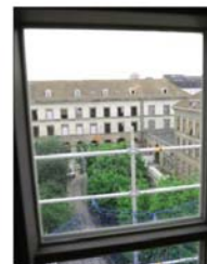
Le site s'étend sur près de 15000m 2 .

Pensé en partenariat avec la coopérative Le Lab – avec laquelle un protocole a été signé le 14 février dernier –, l'espace central de la Manufacture, sur encore en travaux, a connu