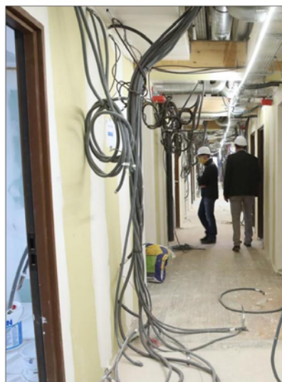
L'îlot au cœur de la Krutenau ressemble à un dédale en pleine révolution.