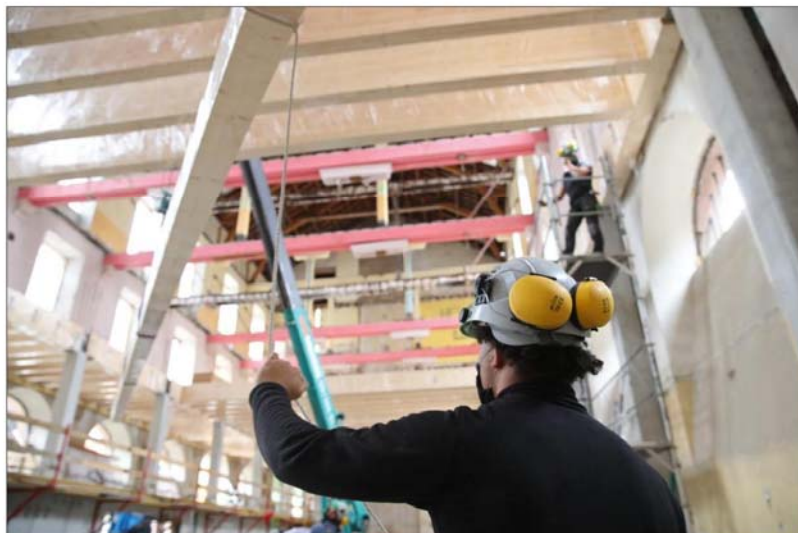
Le chantier de réhabilitation de l'ancienne manufacture des tabacs a repris. Ici, les charpentiers sont à l'œuvre dans le futur amphithéâtre du pôle géosciences.

Au début du mois d'avril, l'aménageur a recruté un « pré-venteur », chargé de mettre en place les mesures sanitaires liées au Covid-19. Aménagements horaires, distribution de masques aux entreprises qui